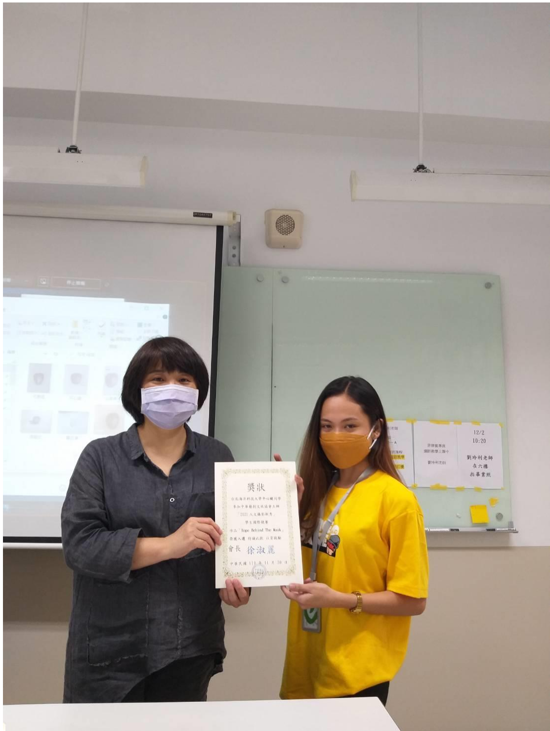
作品「Hope Behind The Mask」榮獲人文攝影新秀入選同學